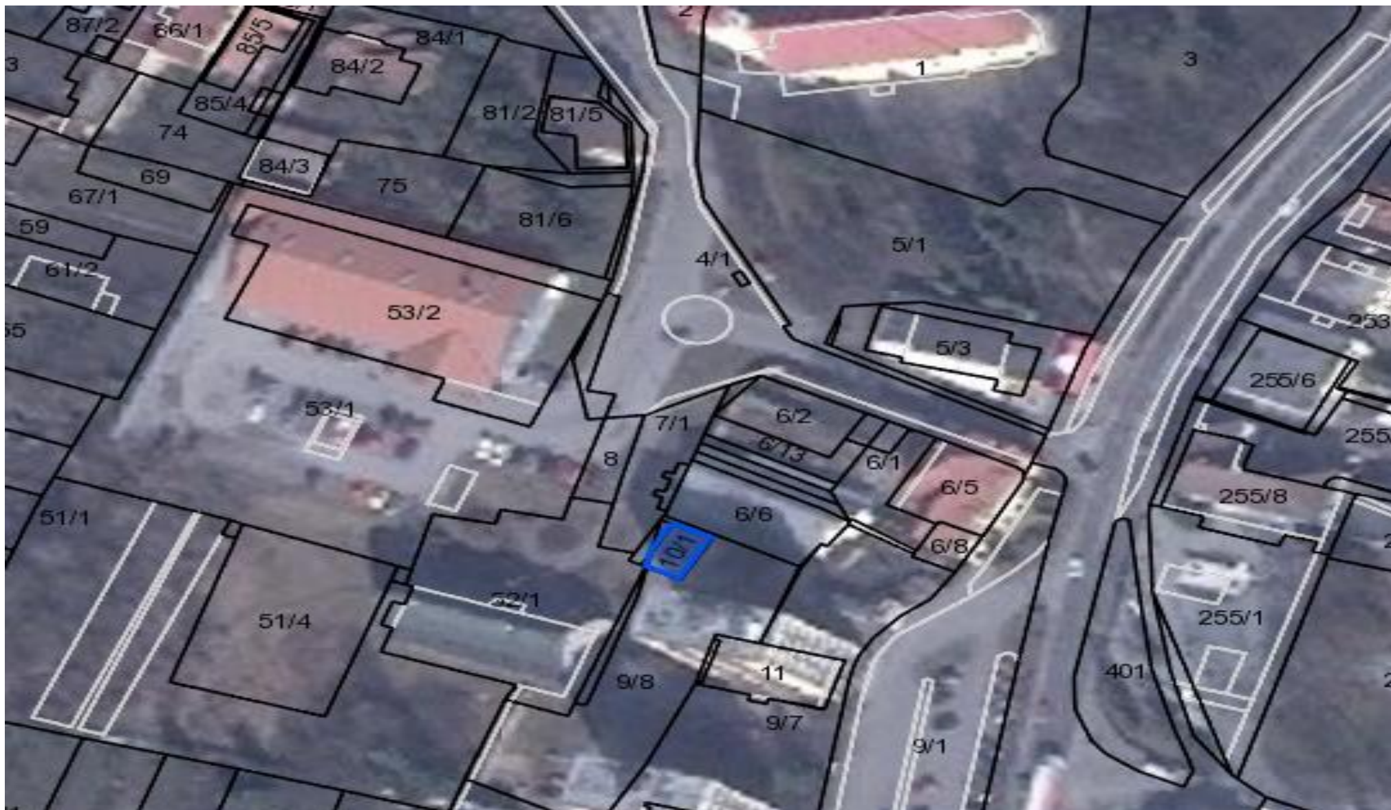
Ľubomír Karak – Ul. A. Hlinku č.459/10, 972 71 Nováky – Žiadosť odkúpenie pozemkov a budovy - par. reg. C KN č. 10/1 – výmera 68m 2 ,