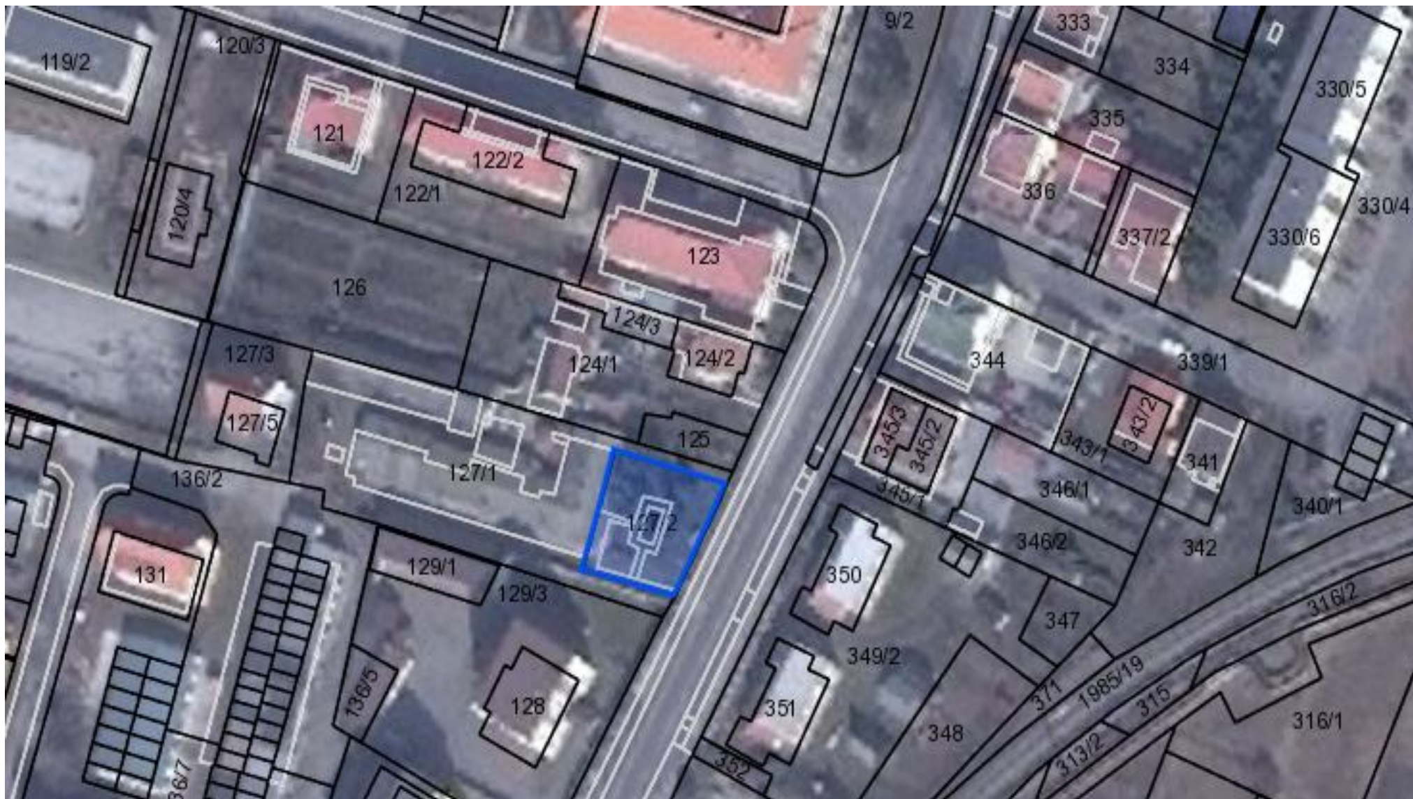
parc. reg. C KN č. 127/2 – ostatné plochy, o výmere 501 m 2 , LV č. 1, k.ú. Nováky, obe nachádzajúce sa na Ul. M.R.Štefánika. pozemok vo vlastníctve MESTO NOVÁKY, 972 71 Nováky